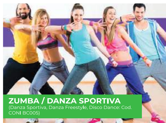
ZUMBA / DANZA SPORTIVA (Danza Sportiva, Danza Freestyle, Disco Dance: Cod. CONI BC005)