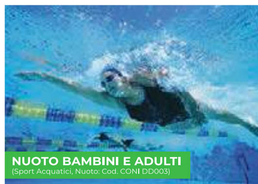
NUOTO BAMBINI E ADULTI (Sport Acquatici, Nuoto: Cod. CONI DD003)