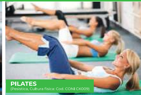
PILATES (Pesistica, Cultura fisica: Cod. CONI CK009)