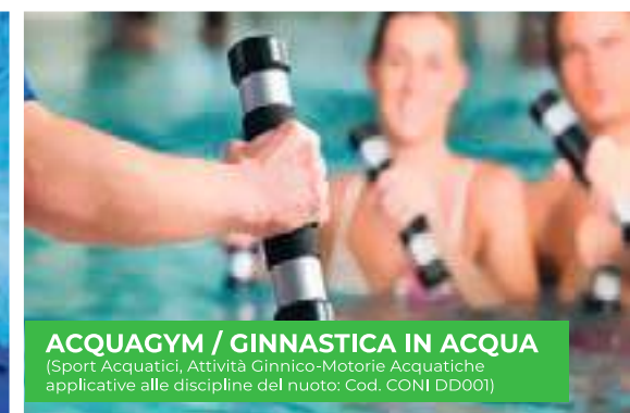
ACQUAGYM / GINNASTICA IN ACQUA (Sport Acquatici, Attività Ginnico-Motorie Acquatiche applicative alle discipline del nuoto: Cod. CONI DD001)